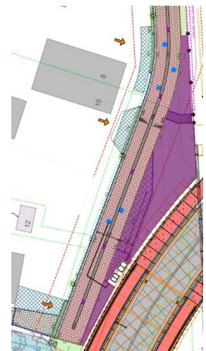
Afbeelding 2 Aan te leggen groenstrook op het Heuveltje

Tijdens de werkzaamheden wordt ook de strook tussen het Heuveltje en het spoor voor de woningen 8 t/m 14 aangepakt. Dit deel staat in het paars op afbeelding 2 weergegeven. In deze strook brengen we verhardingen aan die ProRail toegang geeft tot het spoor en het overige gedeelte zaaien we tijdelijk in met gras. Op een later moment (plantseizoen) brengen we de definitieve beplanting aan. De soort beplanting stemmen we nog af met direct aanwonenden.