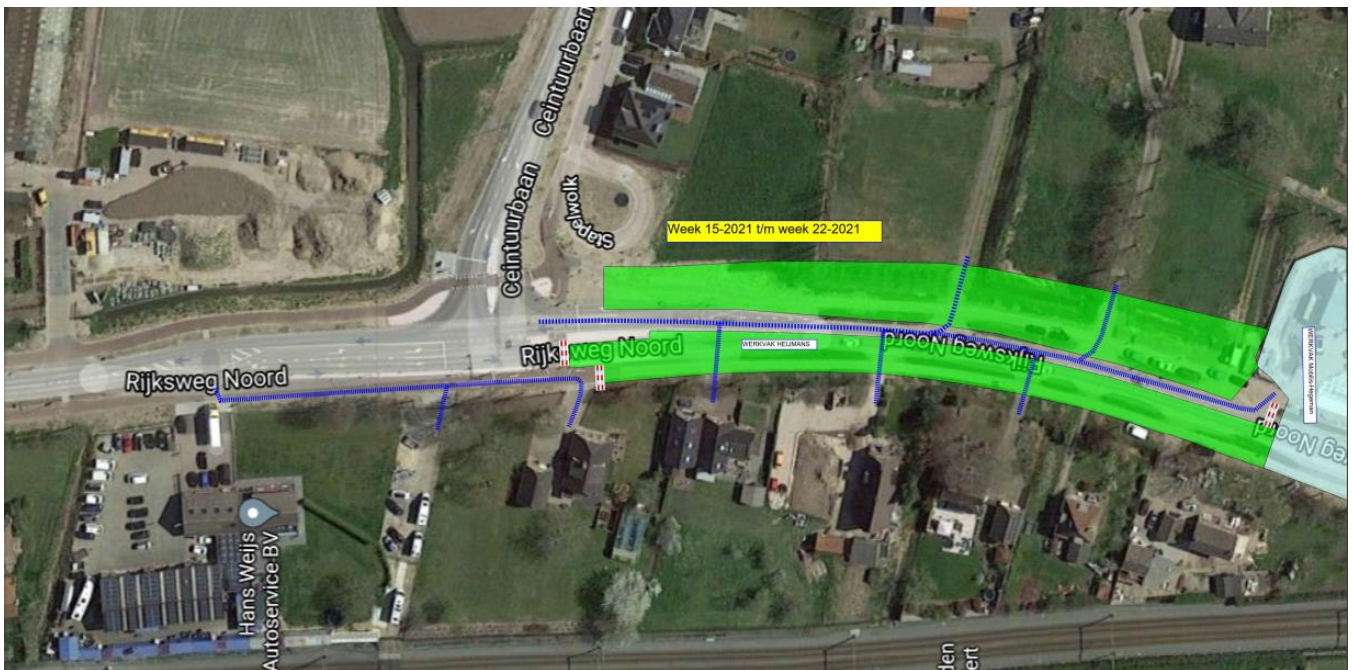
Afbeelding 2 fase 2