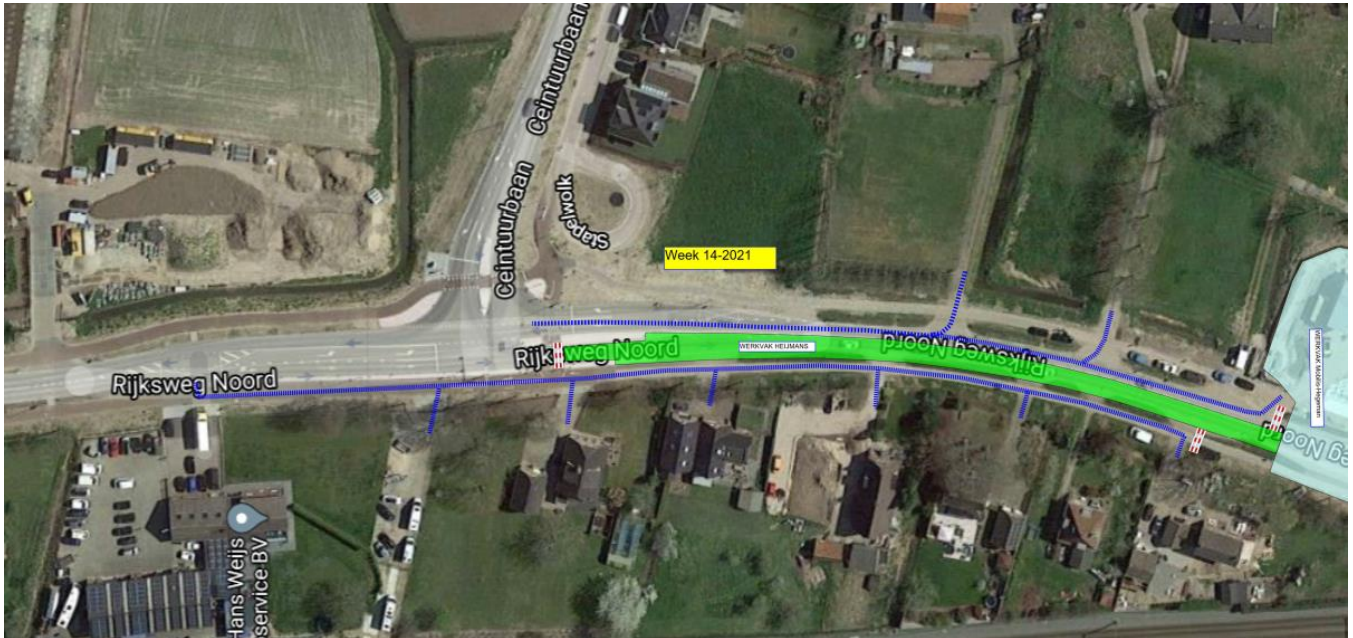
Afbeelding 1 fase 1

met u af. Alle woningen zijn altijd te voet bereikbaar. Op afbeelding 1 staan met blauwe lijnen aangegeven hoe de woningen bereikbaar zijn. Binnen het groene vlak worden de werkzaamheden uitgevoerd.