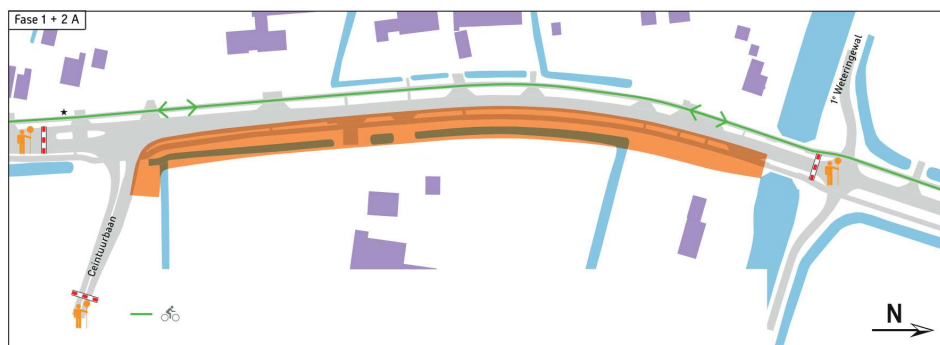
Figuur 1 verkeerssituatie gedurende de weekendafsluiting 5 tot en met 7 juli